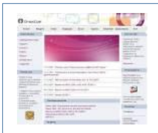
Посети уеб сайта на OmegaСофт